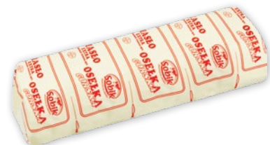
MASŁO OSEŁKA 1 KG