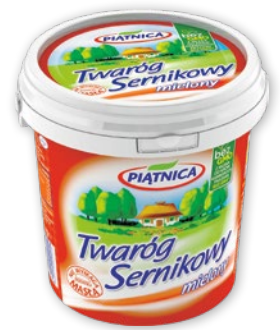
TWARÓG SERNIKOWY 1 KG