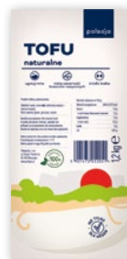
TOFU NATURALNE 1,2 KG

tofu wędzone również w promocyjnej cenie