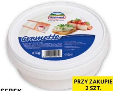
SEREK CREMETTE 2 KG