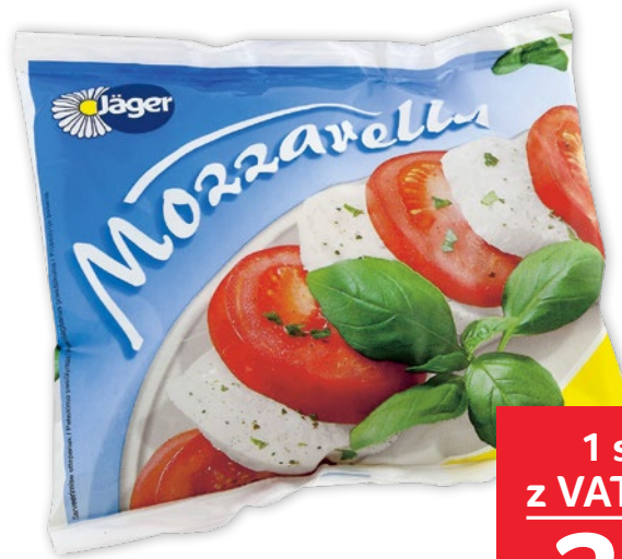
MOZZARELLA 125 G