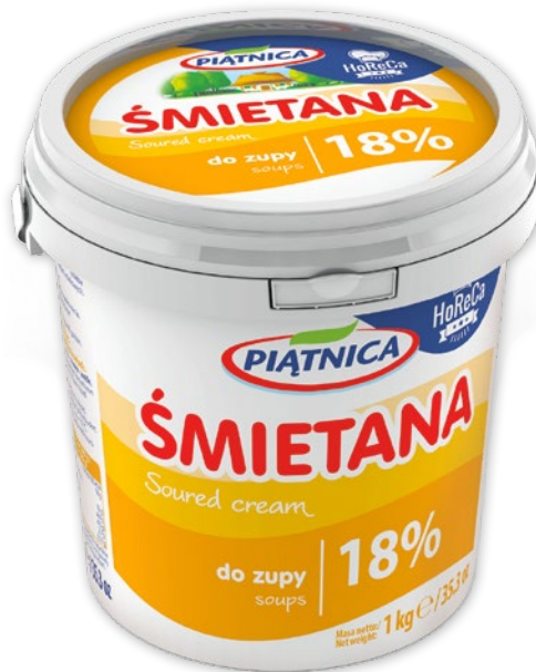
ŚMIETANA 18% 1 KG