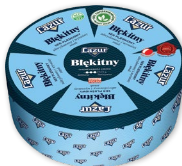
SER LAZUR BŁĘKITNY OK. 2 KG