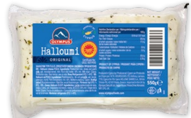
SER HALLOUMI 550 G